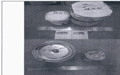
تصویر نمونه ارسال شده جهت انجام آزمون